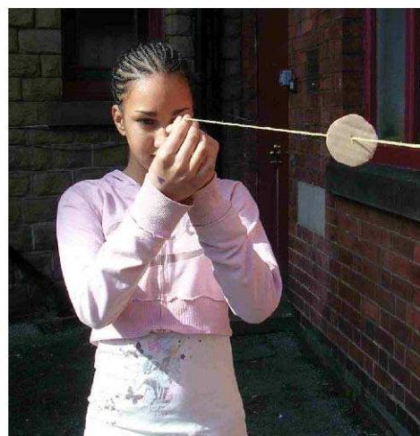
Usare la "Luna" per nascondere il "Sole"

Risposte: la testa dell'altra persona; il vostro pollice; il vostro occhio.