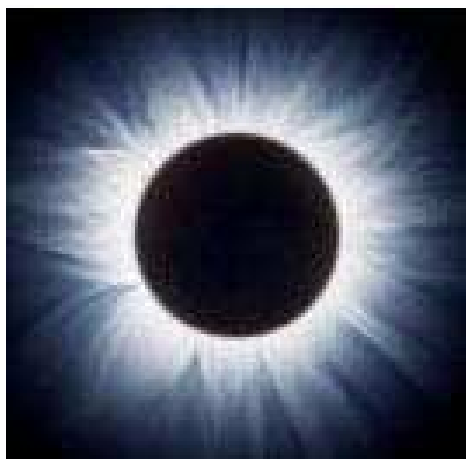
Eclisse di Sole

Questa attività dimostra come un oggetto piccolo, quando è vicino, può impedire la vista di un oggetto molto più grande situato più lontano. Pensate che spesso il Sole e la Luna sembrano avere la stessa dimensione nel cielo? In effetti non hanno affatto la stessa dimensione e tuttavia la Luna può nascondere completamente il Sole, tanto che viene quasi buio. Questo fenomeno è chiamato eclisse totale di Sole (o eclisse solare). Possiamo usare un semplice calcolo, basato su quanto avviene durante un'eclisse solare, per scoprire la dimensione del Sole (il suo diametro). In questa attività vi mostriamo come si può fare usando dei modelli di cartone, con cui potrete trovare il diametro del modellino di Sole. Lo stesso principio si usa per trovare il diametro del Sole (quello vero).